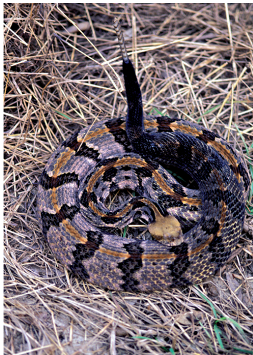
Crotalus horridus .

Het is ondoenlijk om elk hoofdstuk te bespreken. Een recensent van een boek als dit kan nooit of te nimmer de schrijver in zijn bespreking genoegdoening geven voor diens prestatie. Ik wil dan ook slechts één hoofdstuk vanuit een persoonlijke motivatie wat uitgebreider bespreken. Het betreft het relaas in hoofdstuk 21. Means is in de geschiedenis van de ratelslangenjacht gedoken en beschrijft op een bewonderenswaardig neutrale manier hoe in de zuid-oostelijke staten van de V.S. de diamantratslangen bejaagd zijn om hun hoofdrol te spelen in rodeospelletjes, die eindigen met hun dood. Hij heeft helder gekregen, dat 1958 het jaar is geweest, dat als startjaar voor een hele reeks Rattlesnake Hunts kan aangemerkt worden. Om dat boven water te krijgen, heeft Means zich in de archieven van lokale dagbladen begeven, nadat gebleken was dat organisatoren van dergelijke roundups niet erg bereidwillig waren om hem informatie te verschaffen. Hij ontdekte dat het de 'uitvinding' is geweest van het blazen van benzinedampen in schildpadburchten, waarin zich ook ratelslangen ophouden, die de katalysator is geweest voor een snel populair worden van deze spannende activiteit tijdens de winter. Bovendien hadden de roundups toentertijd een warm pleitbezorger in de persoon van ene dr. R.E. Howell, die in de buitengewone omstandigheid verkeerde dat hij een radioprogramma had waarin hij reclame kon maken voor de ratelslangenjacht. Op enige moment is hij zelfs in de wijde om-