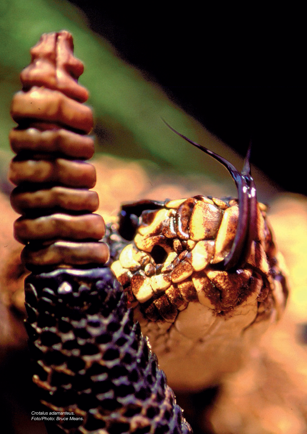
Crotalus adamanteus.